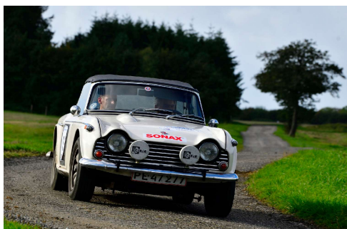
Vinder i SONAX DASU Classic: Lars Hjorth. Side 6.