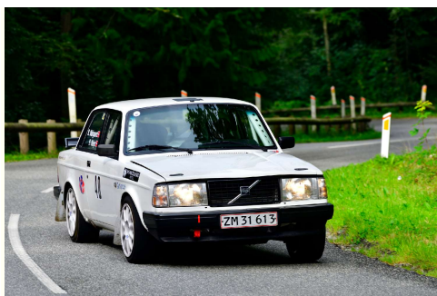
Vinder i Hillclimb: Heino Mejer. Side 6.