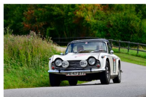
Vinder i SONAX DASU Classic: Lars Hjorth. Side 7.

DRC NYT 2-2024 blev det sidste af ca. 44 blade. Alle udgaver af DRC NYT kan ses på DRCs hjemmeside www.danskrallyclub.dk – OM DRC – DRC NYT.