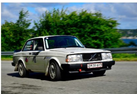
Vinder i Hill climb: Heino Mejer. Side 5.

Side 2: Leder • Side 3: 12 mesterskaber vundet af DRC-kørere i 2024. • Side 4-6: DRC-medlemmernes bedrifter andet halvår 2024 • Noter og nyt Side 7: Medgang og modgang i Oresund Rally • Side 8: Om DASU • Om Dansk Rally Club • Side 9: Super julearrangement hos Marco Gersager